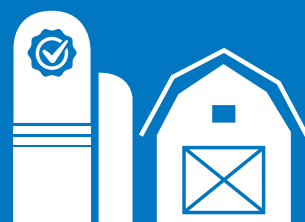
ABORDAGEM NA EXPLORAÇÃO

A força da nossa abordagem na exploração é que, desta forma, conseguimos oferecer produtos nutricionais feitos à medida da sua situação específica. Graças aos nossos muitos anos de aquisição de conhecimentos “na exploração”, à nossa orientação para uma cadeia de alimentação completa e ao nosso know-how nutricional avançado, somos capazes de converter, de forma rápida, novos conhecimentos em soluções práticas para si.