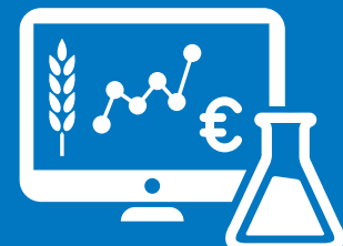
APLICAÇÃO DE CONHECIMENTOS

SOLUÇÕES NUTRICIONAIS FEITAS À MEDIDA PARA CADA CLIENTE